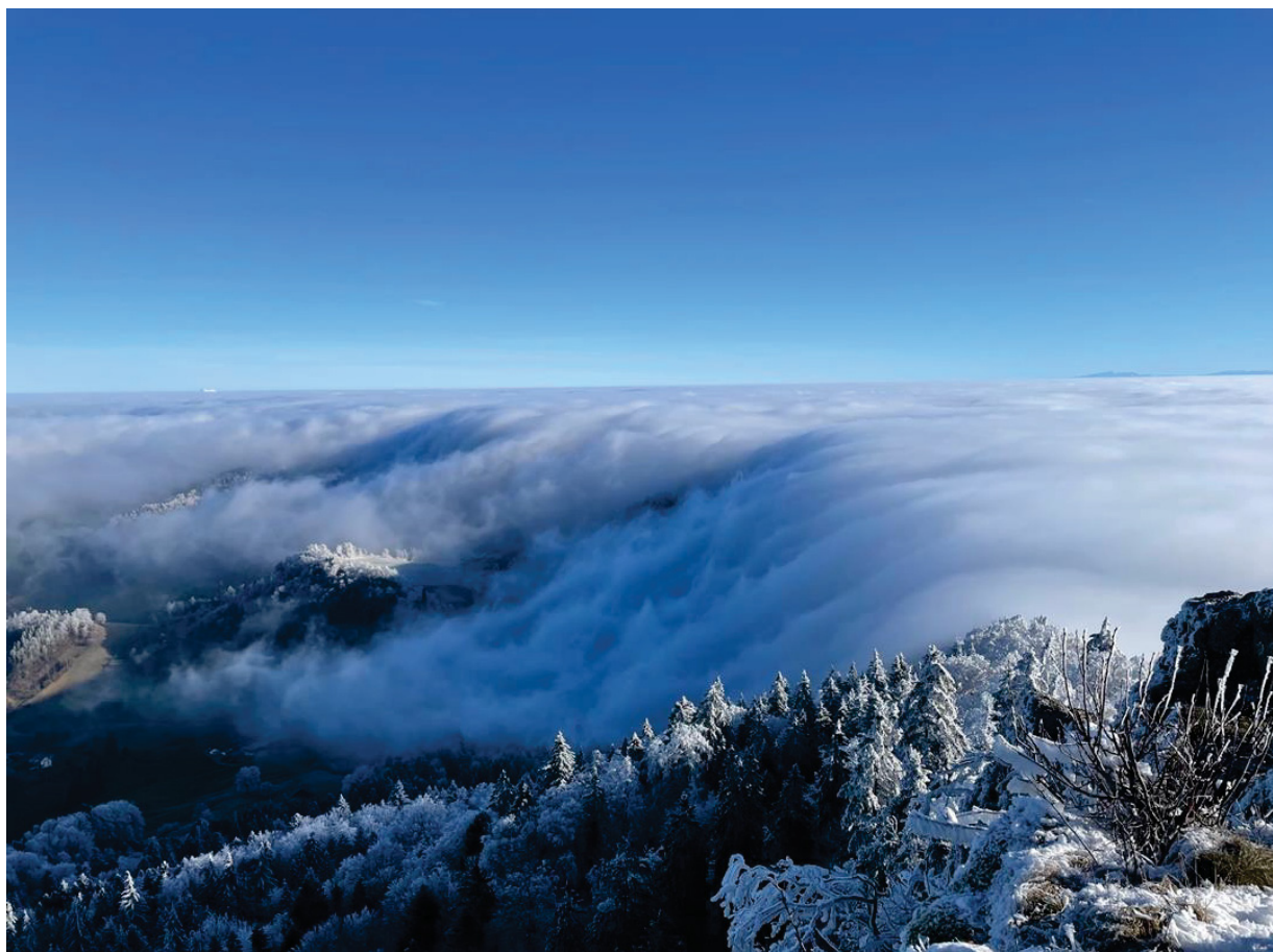
Winterstimmung im Baselbiet